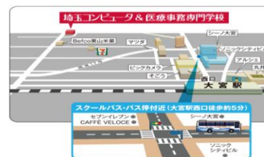
本校(スクールバス乗車場)へのアクセス