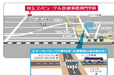
本校(スクールバス乗車場)へのアクセス